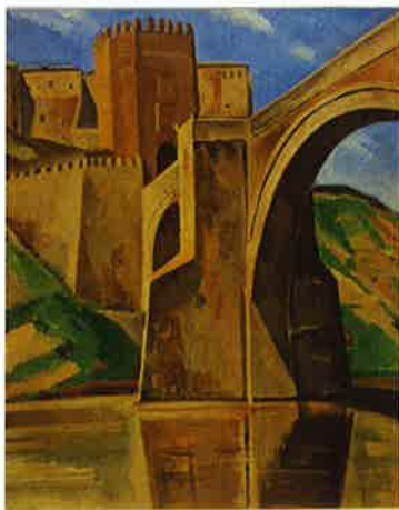
アルカントラの橋 1926年作