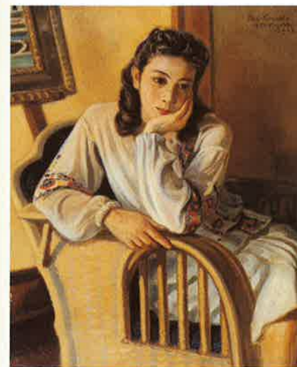
ブルース・ド・ブルガリ 1948年作 ブルガリアのブラウスを 着た息女蓉さんがモデル