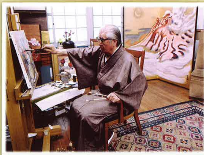
作品を制作する画伯